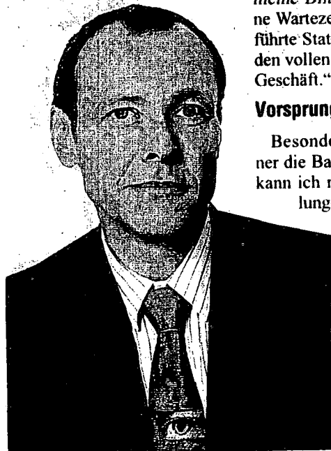
Das Team des Innsbrucker Softwareherstellers CPS Radlherr GmbH steht für Qualität in Softwareentwicklung und Kundenbetreuung.